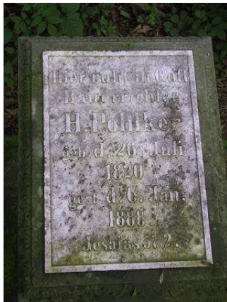
Bild: Grabstein aus dem Friedhof in Bad Meinberg