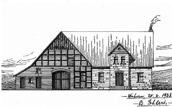
Bild: Hof Pöhlker Wehren Nr.19