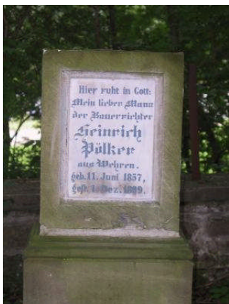
Bild: Grabstein auf dem Friedhof von Bad Meinberg