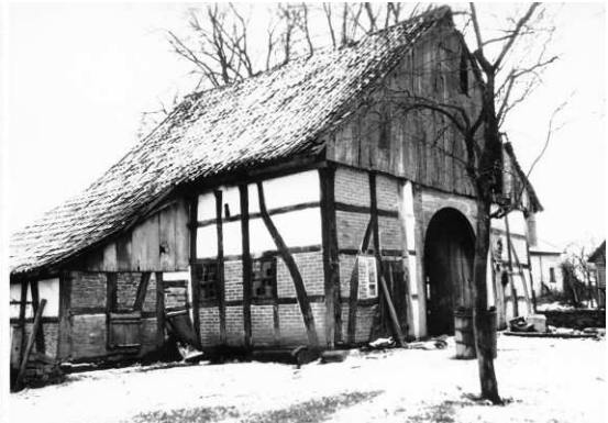
Bild: Wehren Nr. 4 Keiser links Zeichnung von Ehlert rechts abgerissenes Haus 1955