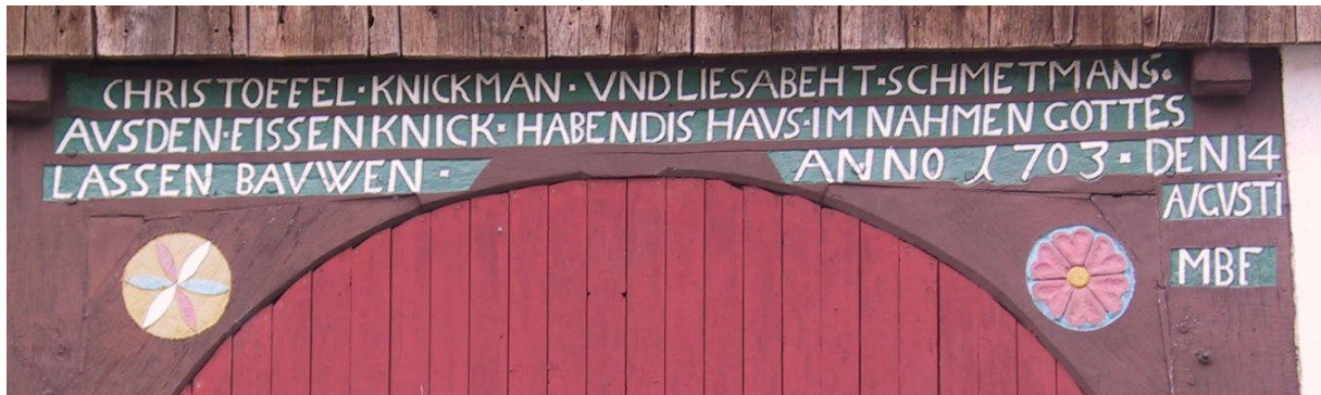
Bild: Hausinschrift von 1703